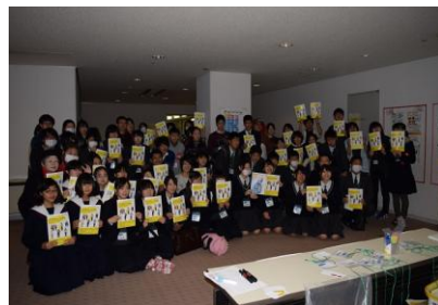
国際理解教育講座