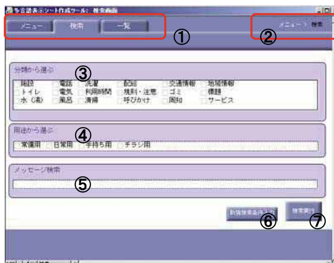
図表 3 検索画面