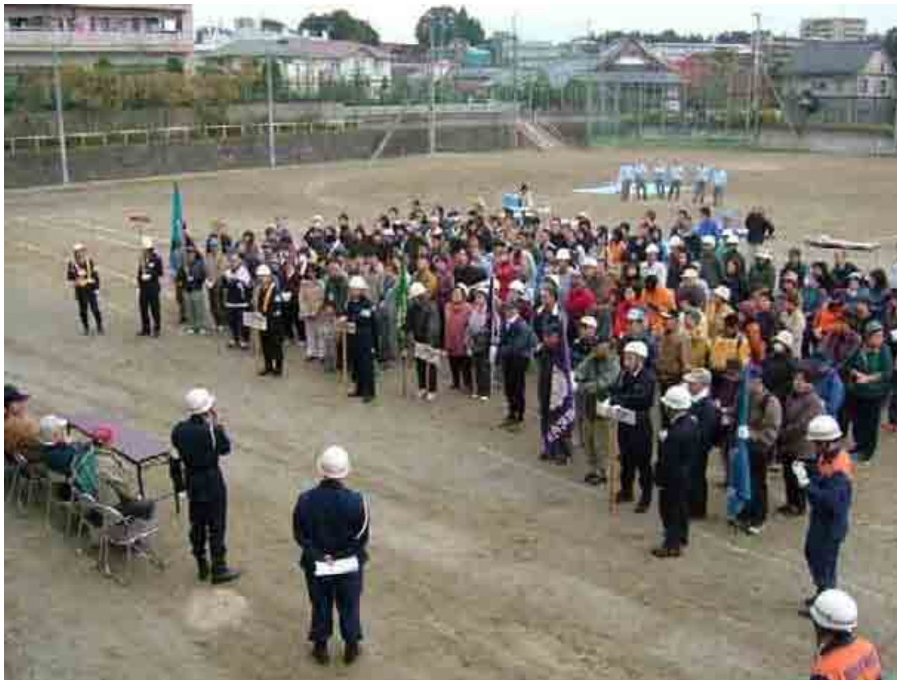
仙台市青葉区三条町 連合町内会