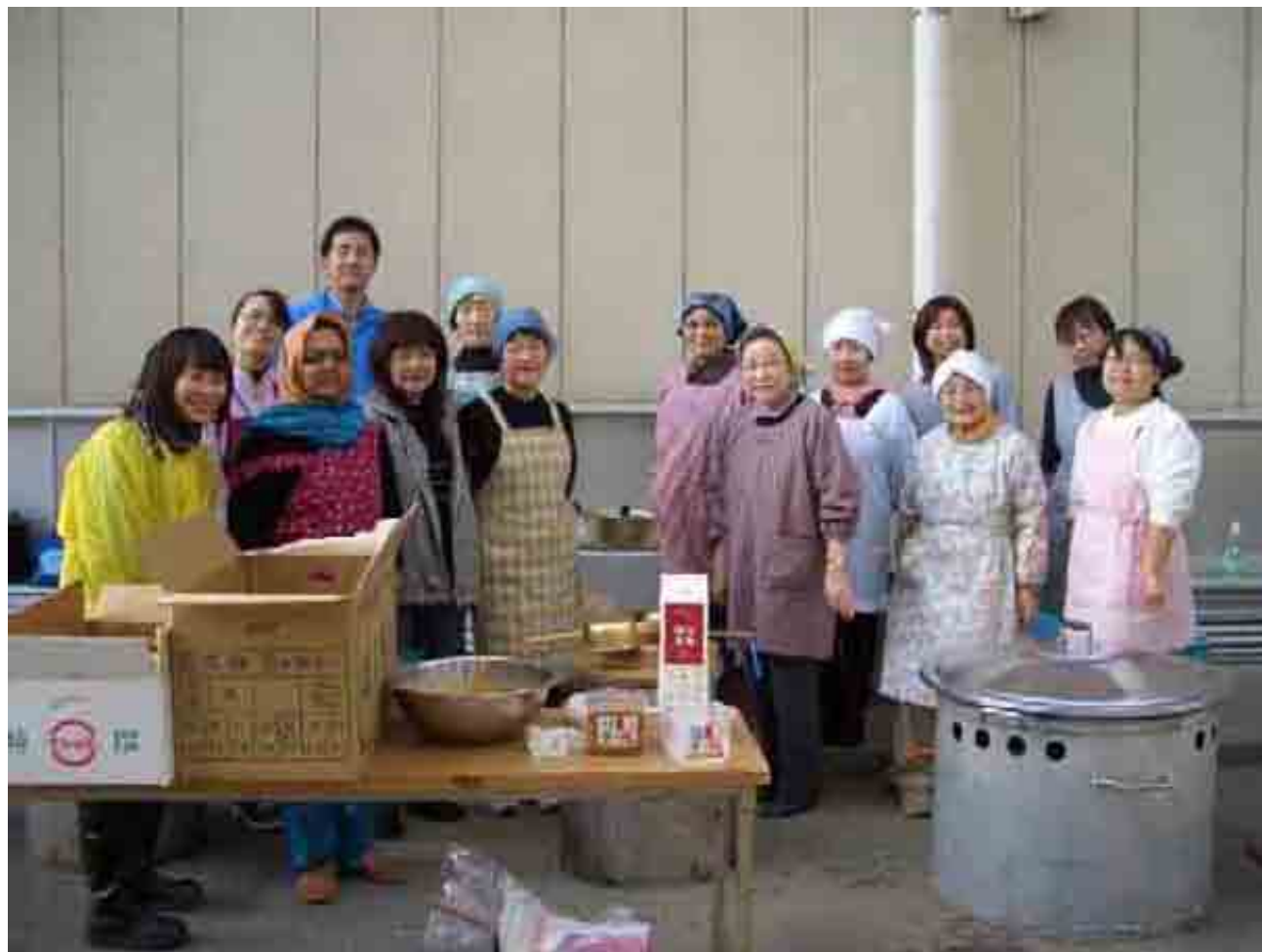
非常食の炊き出し「アルファ米とハラルカレー」